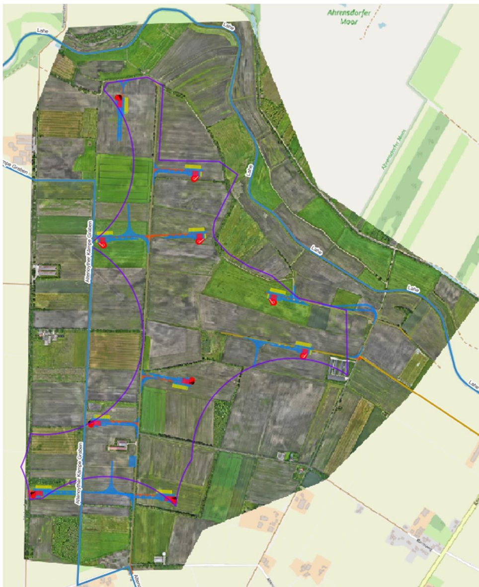
Abbildung 2: Orthofoto aus Drohnenbefliegung mit überlagerter Planung (Stand 22.07.2025)

Zur Erstellung eines digitalen Geländemodells zur späteren genauen Ermittlung des Retentionsvolumens, wird das Projektgebiet mittels Photogrammetrischer Aufnahme und Auswertung vermessen (siehe Abbildung 2).