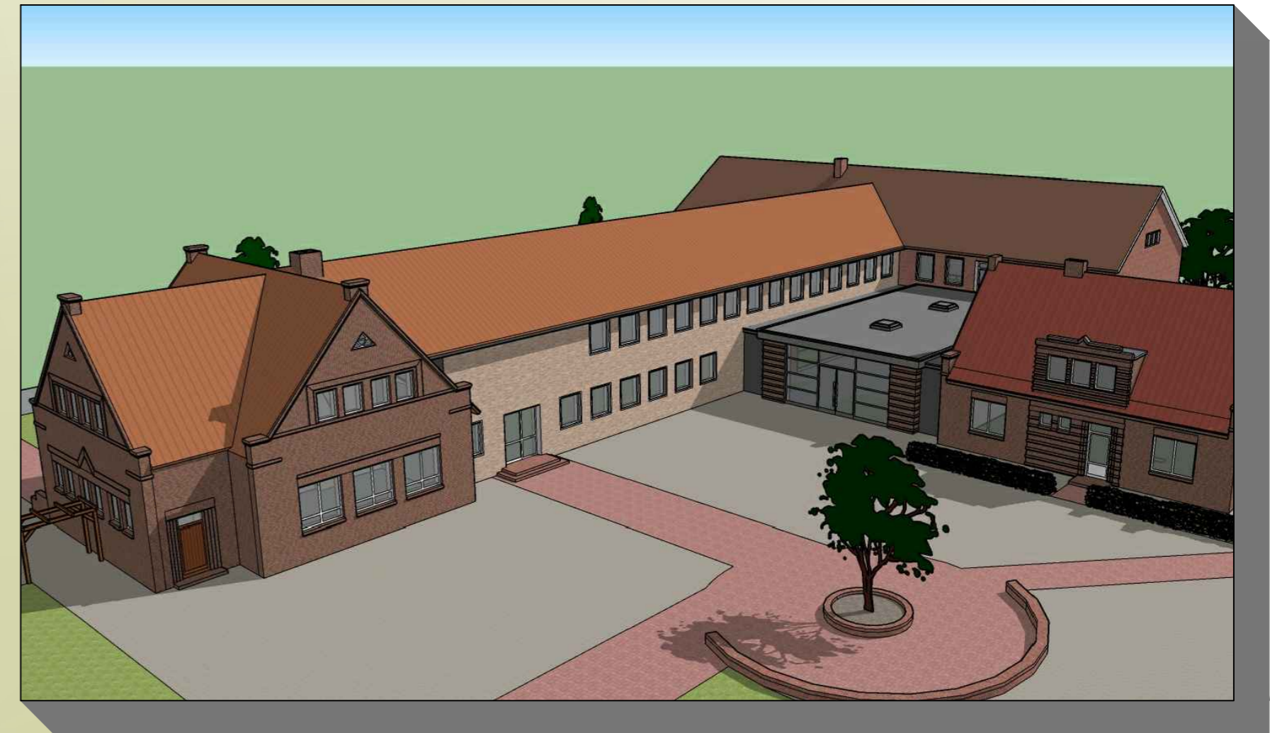
PLANUNG ANSICHT 1