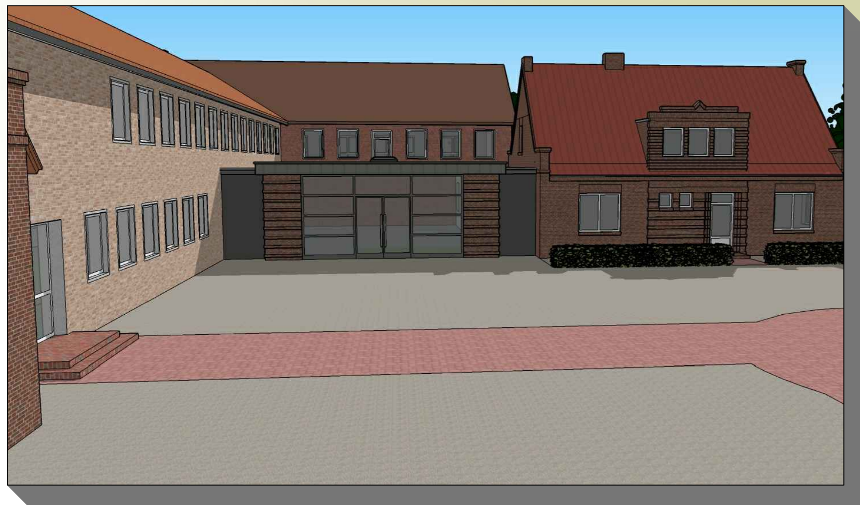
PLANUNG ANSICHT 2