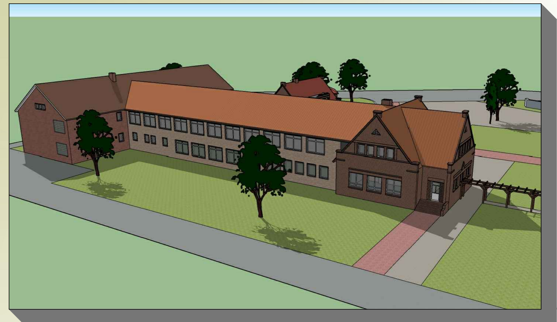
PLANUNG ANSICHT 3